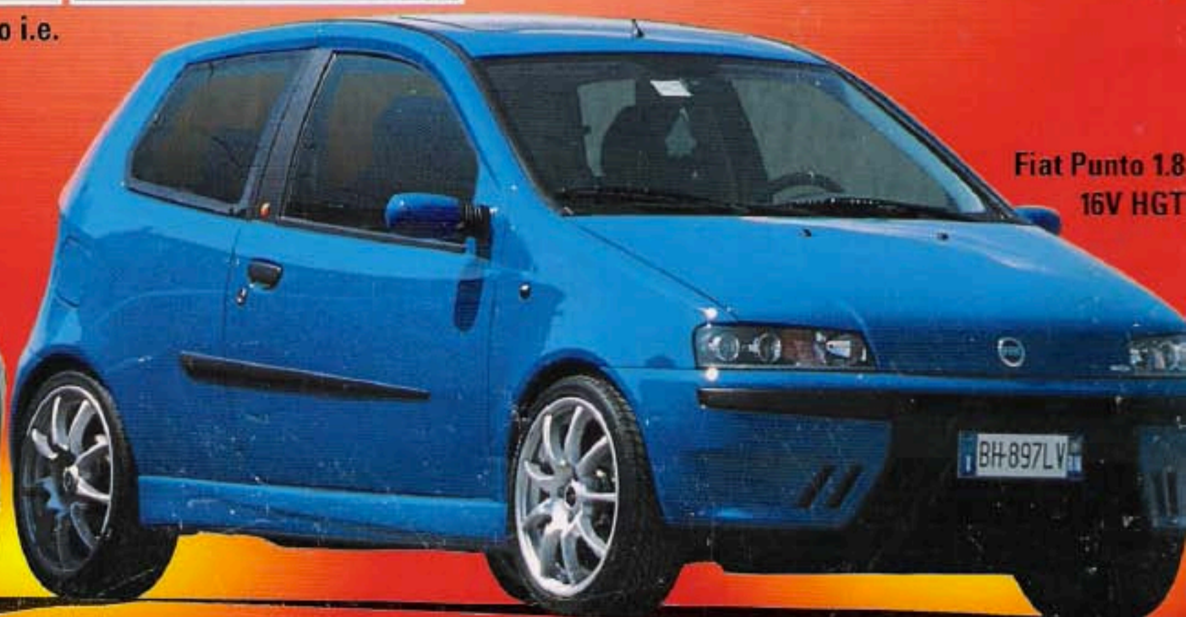
Fiat Punto 1.8 16V HGT