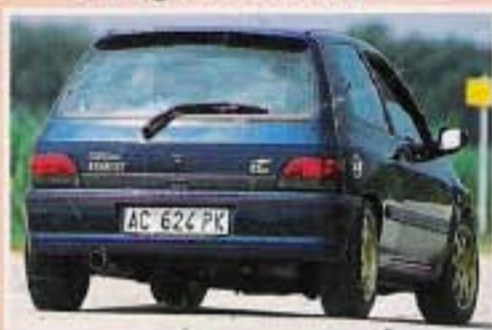
Renault Clio Williams