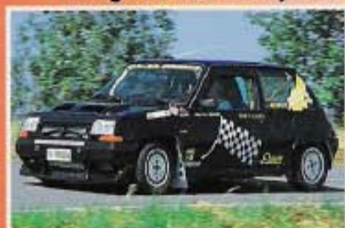
Renault 5 GT Turbo