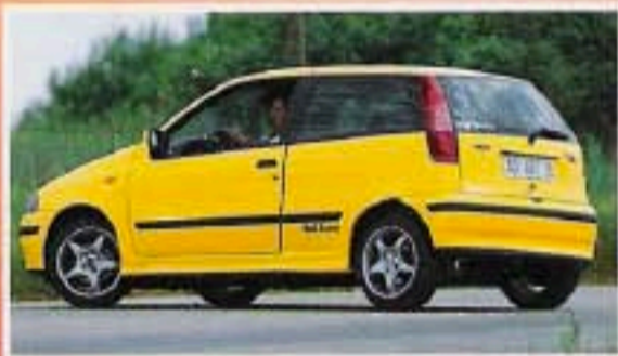
Fiat Punto GT

25 anni di GTI Supertest: stradali contro elaborate