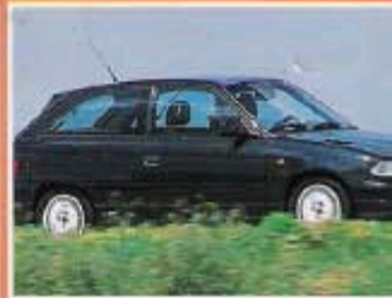
Opel Astra 2.0 GSI 16V