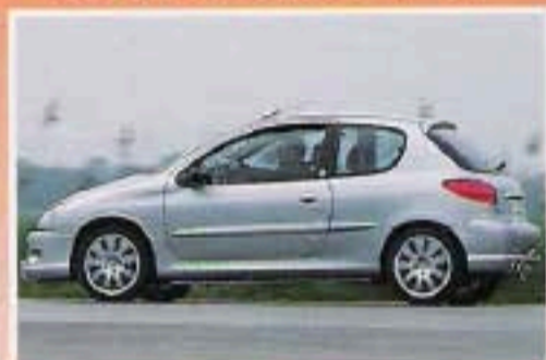
Peugeot 206 GT