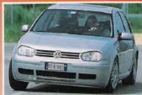
VW Golf GTI IV a Serie