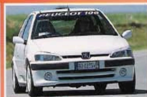
Peugeot 106 Rallye 16V