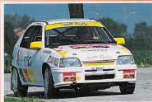
Opel Kadett 2.0 GSI 16V