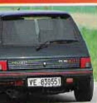
Peugeot 205 GTI 1.9