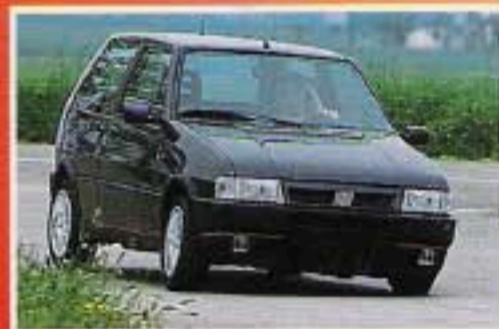
Fiat Uno Turbo i.e.